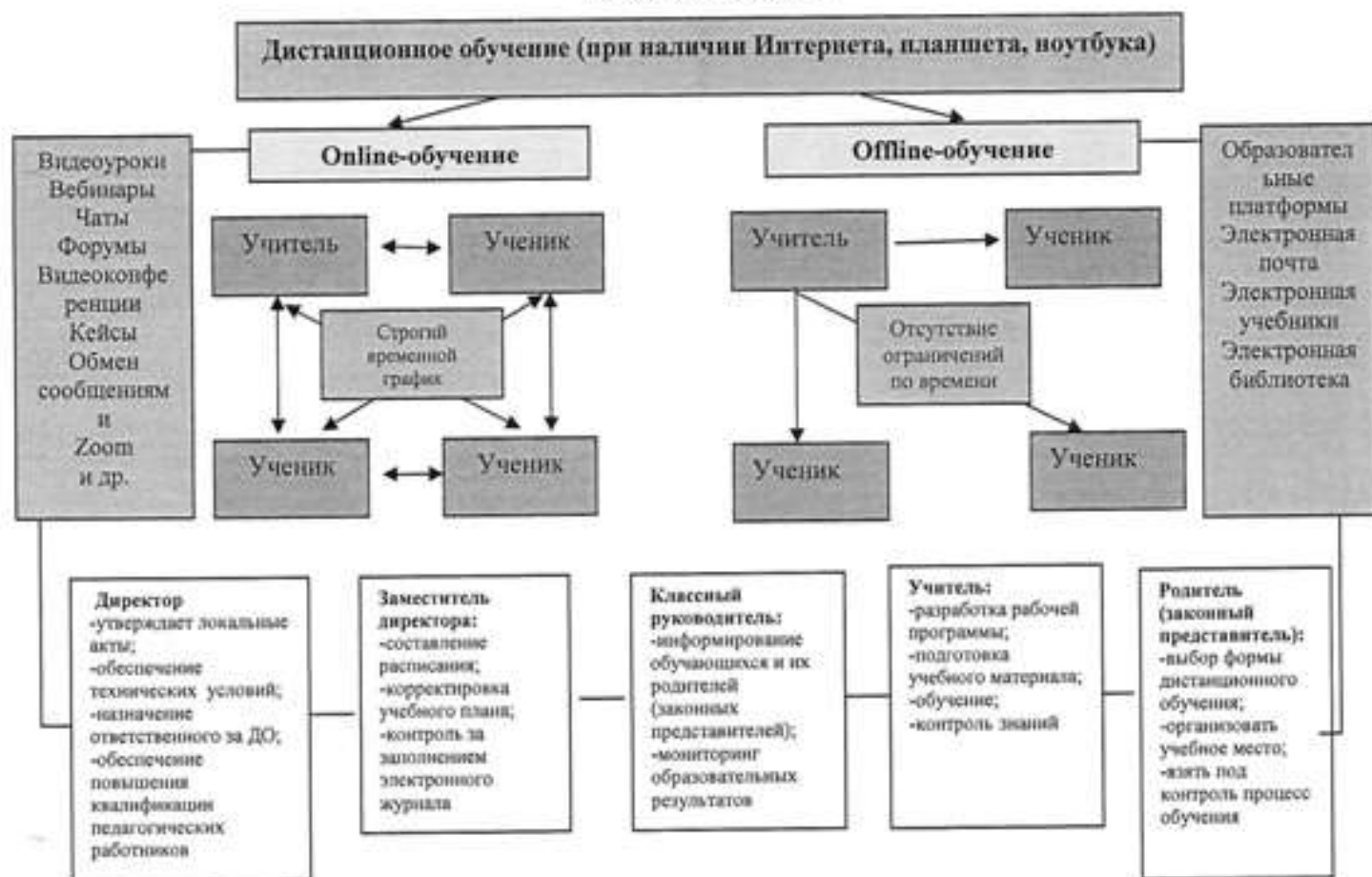
Схема модели 1

Модель 2. Реализация образовательных программ начального общего, среднего общего образования, дополнительных программ с применением сотовой (мобильной связи)