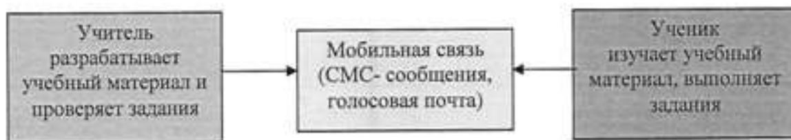
Схема модели 2

Модель 3. Реализация образовательных программ начального общего, среднего общего образования, дополнительных программ при отсутствии возможности применения электронного обучения и дистанционных образовательных технологий, также сотовой (мобильной) связи